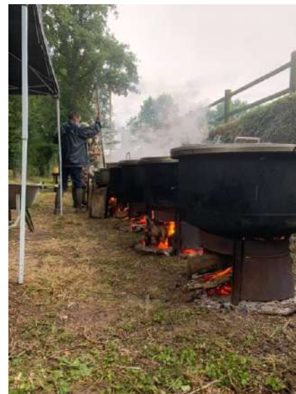
Les membres du Comité des Fêtes de St Nicolas

Le Comité des Fêtes vous souhaite une bonne et heureuse année 2022.