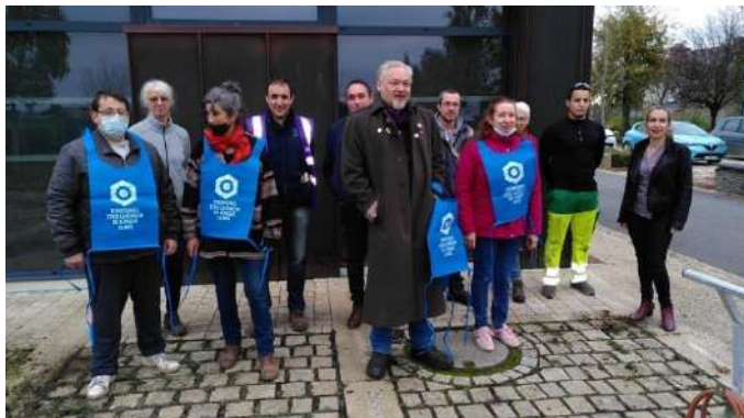
Durant la grève du chômage de Novembre dernier, les Faisous de l'Oust ont notamment réalisé un chantier d'entretien des espaces verts au sein de la commune de St Nicolas du Tertre.

En ce début d'année, l'actualité est dense pour le projet Territoire Zéro Chômeur de Longue Durée (TZCLD). Depuis 2019, des Personnes Privées Durablement d'Emploi (PPDE) sur les communes de Carentoir, Saint-Nicolas-du-Tertre, Réminiac et Tréal participent à la mise en œuvre de l'expérimentation portée par de l'Oust à Brocéliande Communauté.